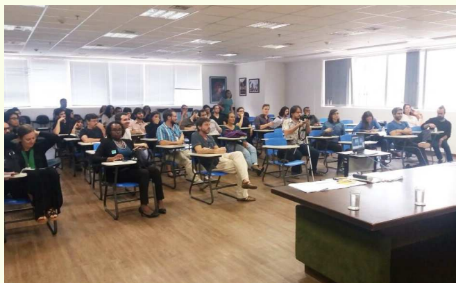
Apresentação da INA para servidores da Funai

Em março, a INA fez ainda sua campanha no 8M Brasil, movimento internacional de luta pela vida das mulheres, da defesa da democracia, defesa dos direitos conquistados e contra o racismo. Temos participado de encontros de troca de experiências e articulação entre servidoras da Funai de Brasília e do